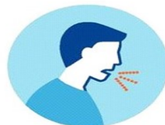
ВОЗДУШНО- КАПЕЛЬНЫЙ ПУТЬ

Через зараженные поверхности – рукопожатия, поручни в транспорте, дверные ручки, другие предметы и поверхности.