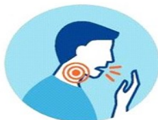
КАШЕЛЬ И/ИЛИ БОЛЬ В ГОРЛЕ