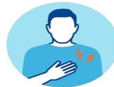
БОЛЬ В МЫШЦАХ