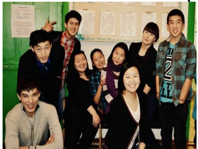
Знакомьтесь, господа журналисты!